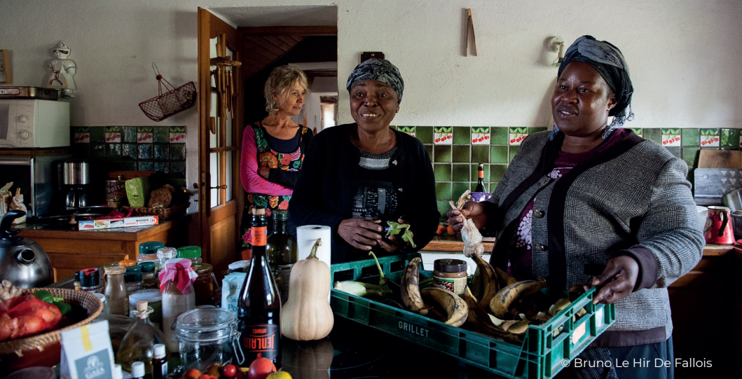
© Bruno Le Hir De Fallois